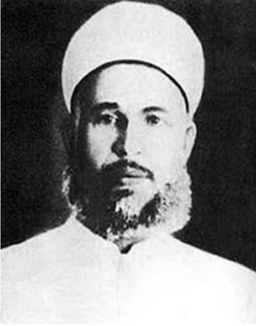
أمير المجاهدين الشهيد عز الدين القسام